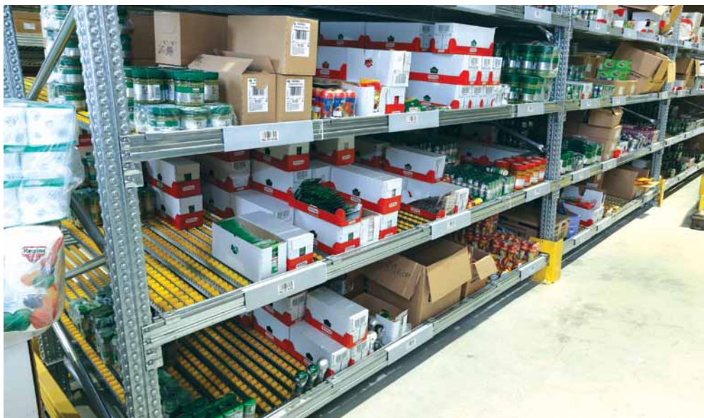
Moderna oprema omogućava nesmetano komisioniranje i dopunu zaliha

problema pri implementaciji WMS rešenja, ali ljudi iz S&T su bili fizički prisutni u našim prostorijama, tako da su sa našim programerima uspijevali da sve greške i nepravilnosti otklone u hodu i rade na podešavanjima kako bi sve funkcionisalo.