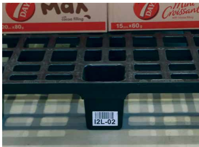
Inteligentno postavljen tok informacija olakšava i ubrzava rad