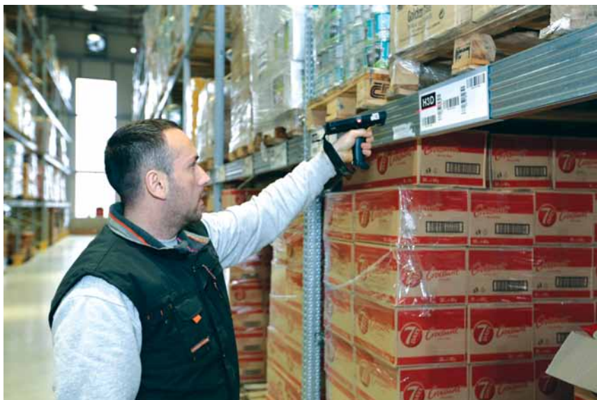
Sledljivost proizvoda obezbeđena je sistemom za upravljanje skladištem koji kontroliše sve operacije

danas, tako da su prelaskom u novi magacin bili potpuno spremni da rade u WMS sistemu, samo što im je okruženje bilo drugačije.